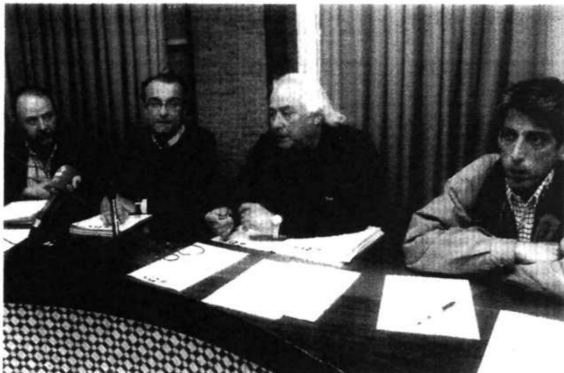
Representantes de CGT, APIA, USTEA y SAVI ayer en la Delegación de Educación de Sevilla

Asimismo exigen que la ratio de los centros se baje a 20 en primaria, a 25 en ESO y a 30 en la enseñanza posobligatoria. Piden a la Consejería que desburocratice el trabajo de los profesores y sobre todo que haya un incremento progresivo de la inversión hasta situarla en el 7% del PIB.